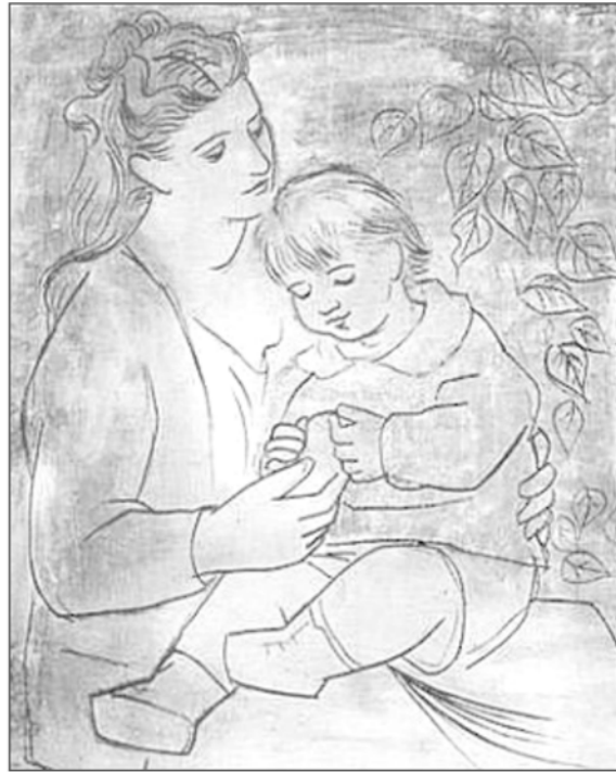
Moeder en Kind