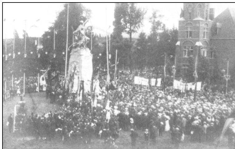
In augustus 1906 werd in Kortrijk het Groeningemonument onthuld. De Clercq was al van in zijn studententijd in de weer geweest om een monument op te richten.

De plannen voor een Wereldtentoonstelling, die in 1913 de laatste van de Belle Epoque zal worden, beginnen een steeds concretere vorm aan te nemen. Verkavelingsplannen worden opgesteld en de grondwerken voor de taluds van Gent-Sint-Pieters aangevat. Op Vlaams gebied dient ook vermeld dat op 5 augustus 1906 het Groeningemonument van Godfried Devreese in Kortrijk wordt onthuld. De Clercq en Alfons Sevens hadden zich vijf jaar te voren ingespannen om via een geldinzameling een monument te verkrijgen maar de overheid had het idee overgenomen en gerealiseerd.