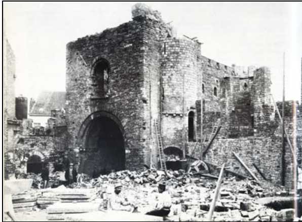
De ontmanteling en heropbouw van het Gentse Gravensteen stimuleerde sterk de romantische bewustwording