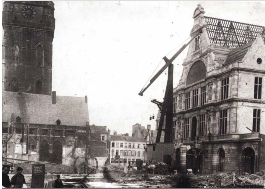
De Vlaamse Schouwburg in Gent (hier in opbouw in 1898 na 30 jaar moeizame strijd van de Vlaamsgezinden) waar De Clercq's zangspel 'De Vlasgaard' 23 keer werd opgevoerd.

Op 8 oktober 1905 heeft in de Vlaamse Schouwburg de première plaats van de muzikale versie van De Clercq's succestoneelstuk uit 1901 De Vlasgaard . Omdat het stuk nu moet dienen voor de Gentse socialistische aanhang werden de klassentegenstellingen in de nieuwe versie nog wat aangescherpt.