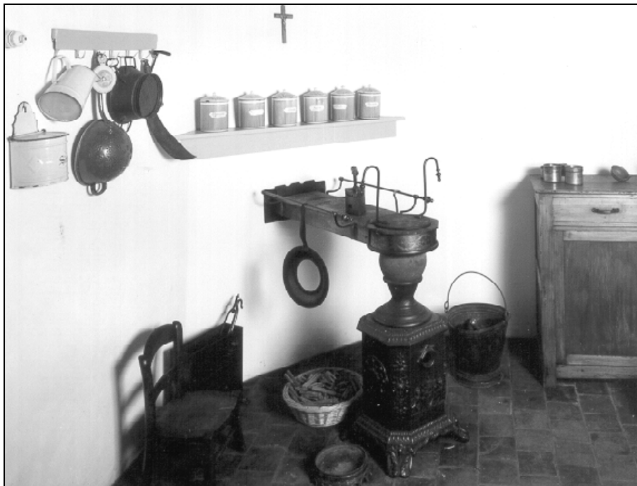
Museum René De Clercq - zicht van de keuken en het stoofje